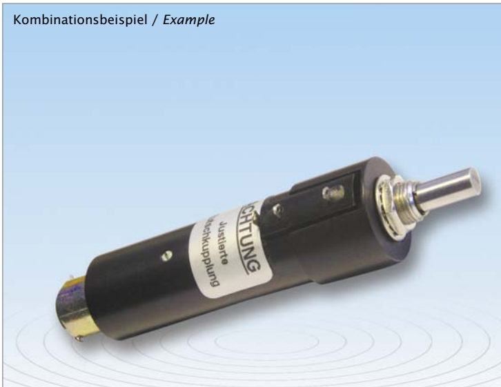
Kombinationsbeispiel / Example