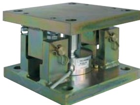
Kit de montage SILOSAFE-R SILOSAFE-R mounting kit