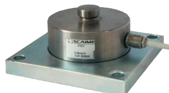
Kit de montage PLAQUE R10X R10X PLATES mounting kit