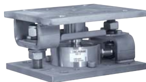
Kit de montage SILOKITR SILOKITR mounting kit